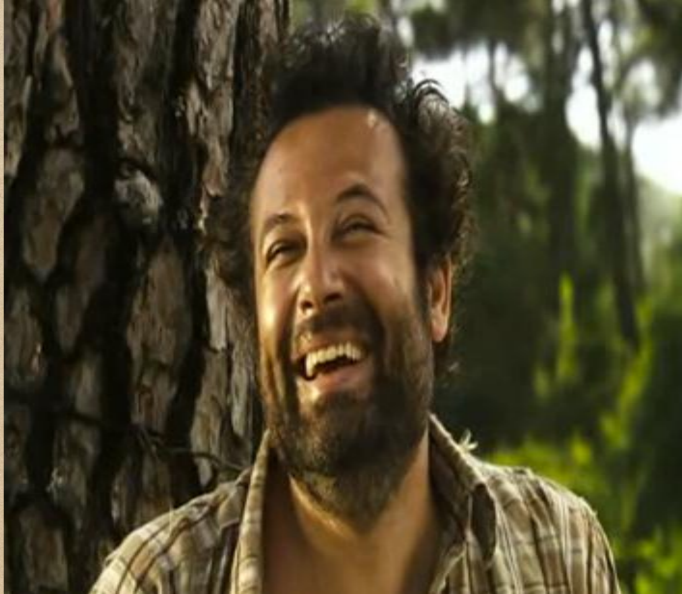
Abimm Filmdeki Engelli Karakter Arif.