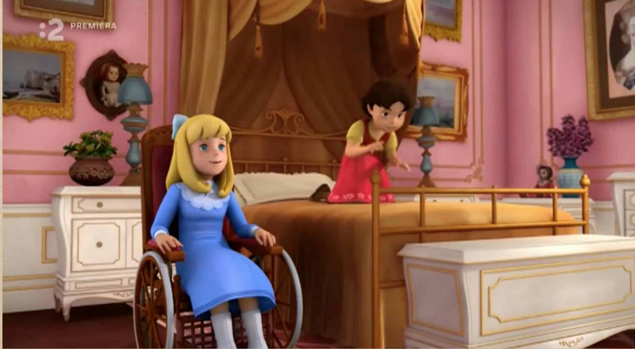
Heidi Çizgi Filmindeki Clara.