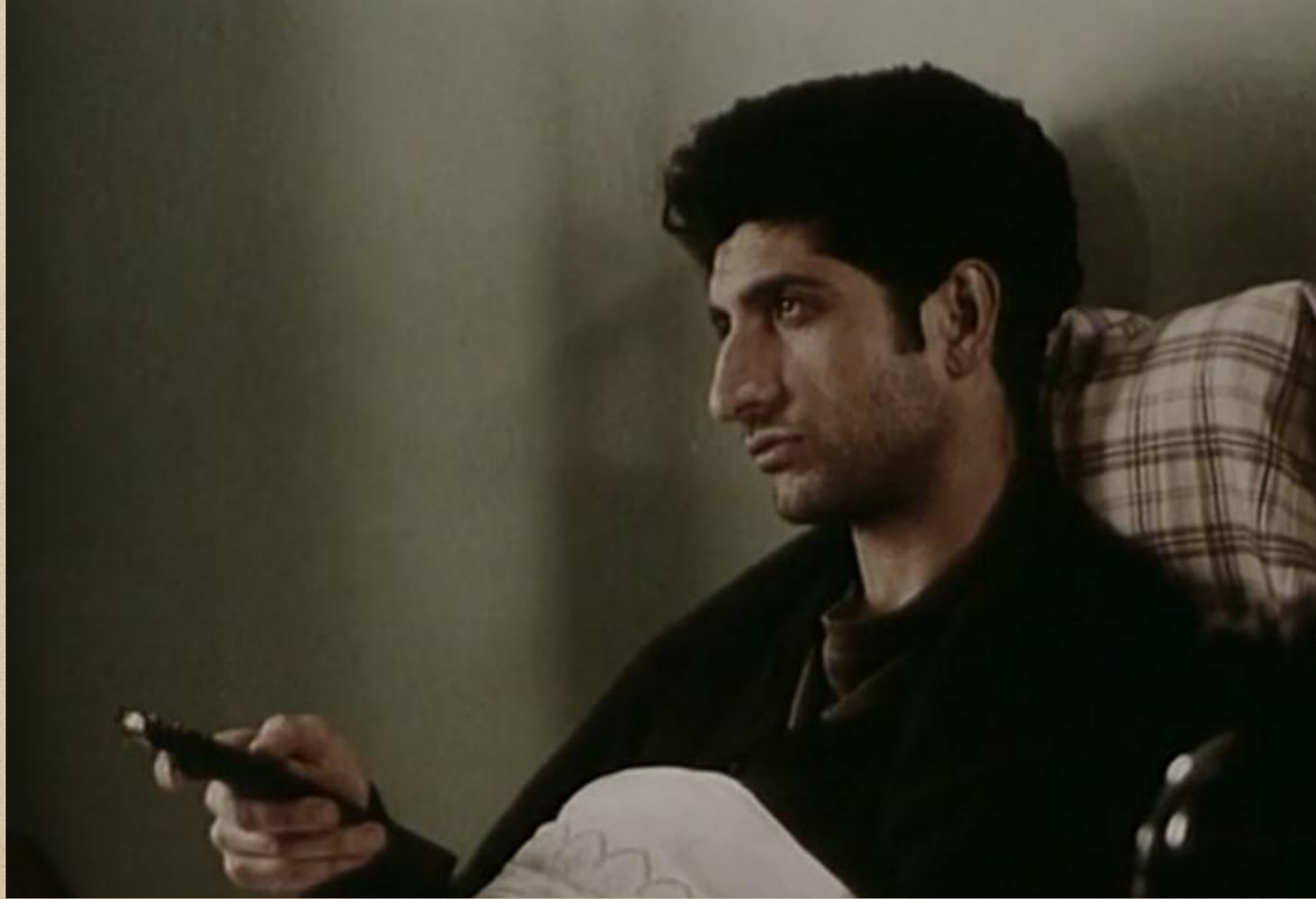
Filler ve Çimen Filmindeki Engelli Karakter İldem.