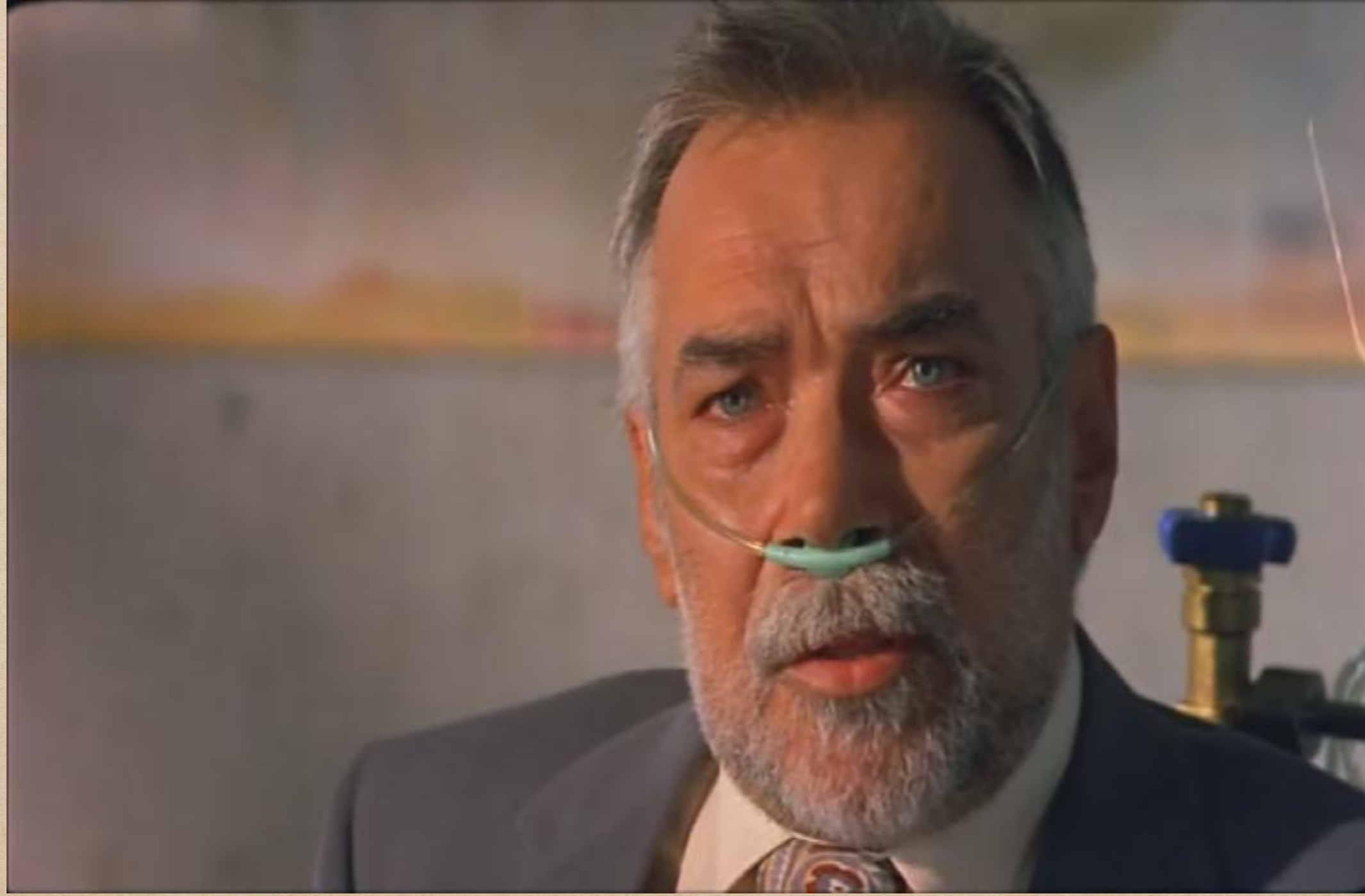
EŐkiya Filmindeki Engelli Karakter Berfo.