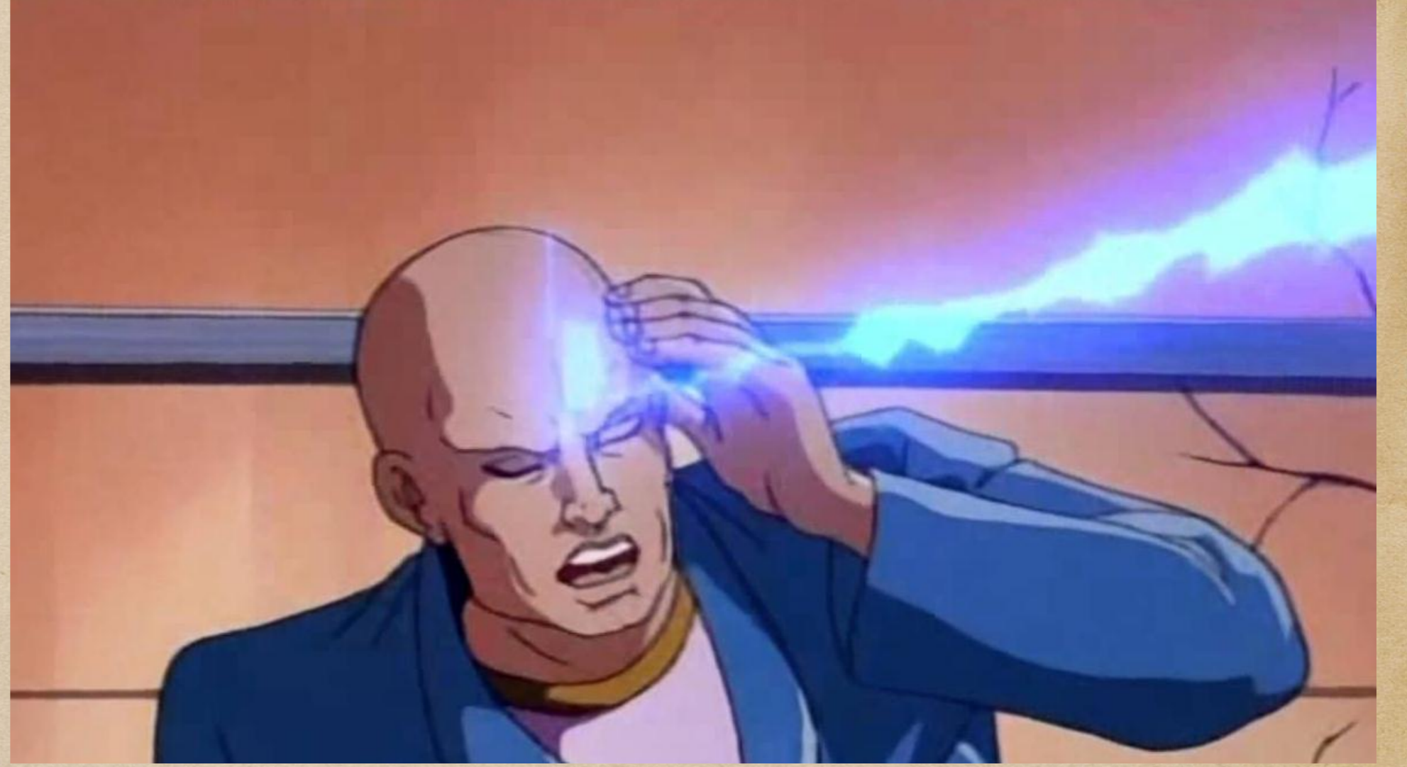
X-Men Çizgi Filmindeki Profesör X.