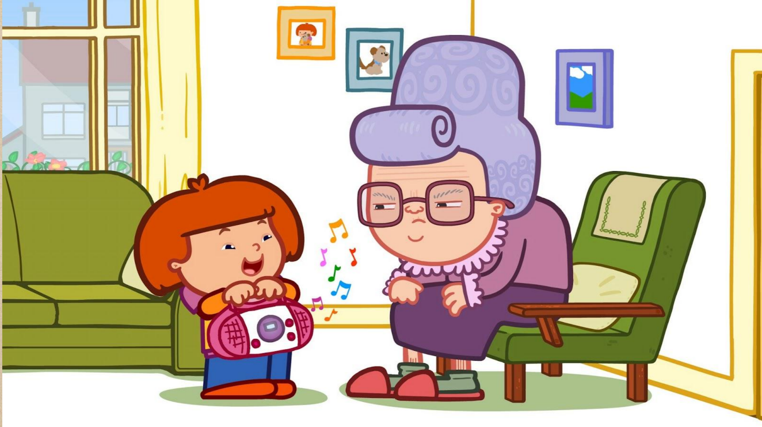
Punky Çizgi Filmindeki Punky.