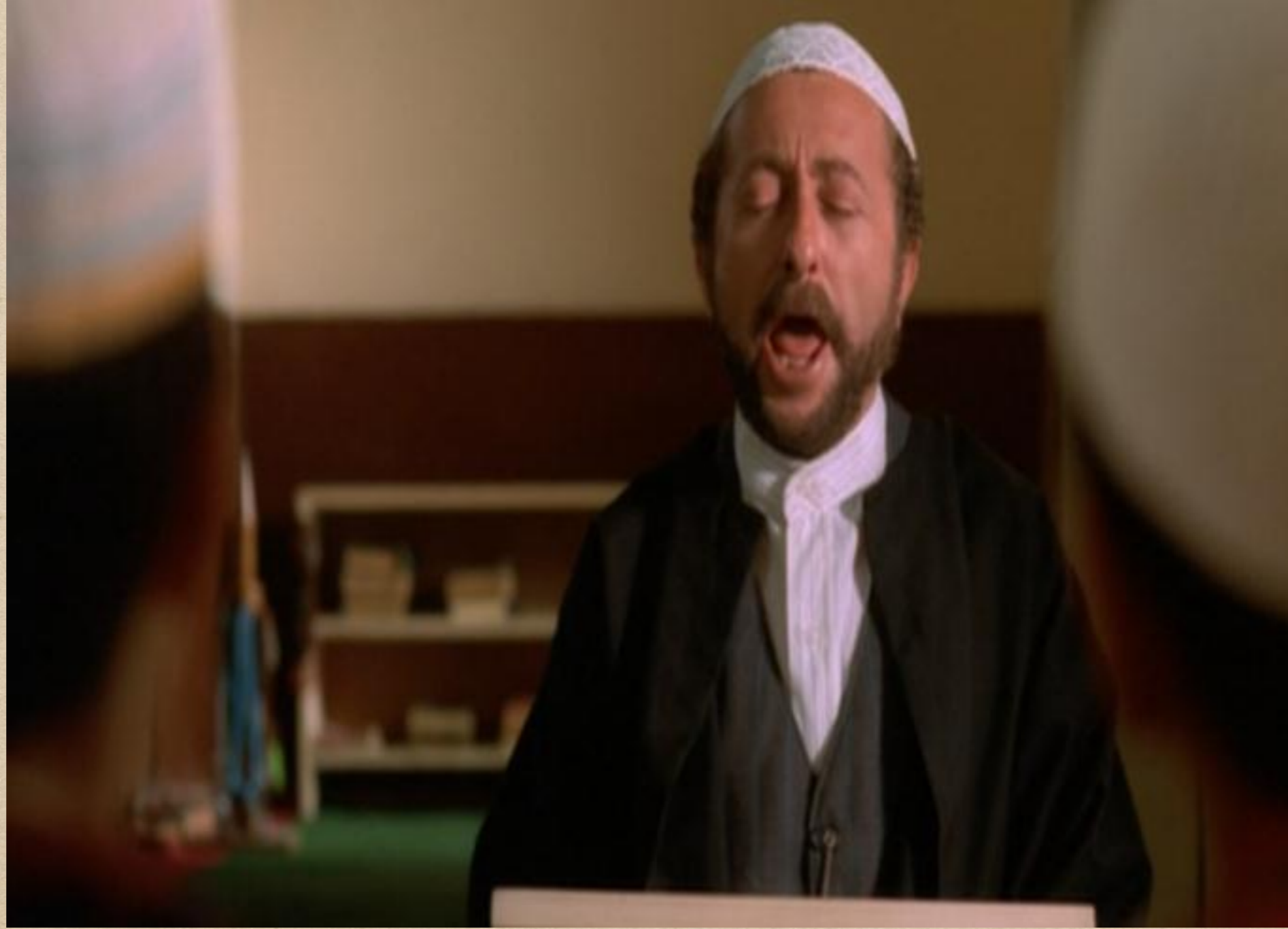
Vizontele Filmindeki Engelli Karakter Melo.