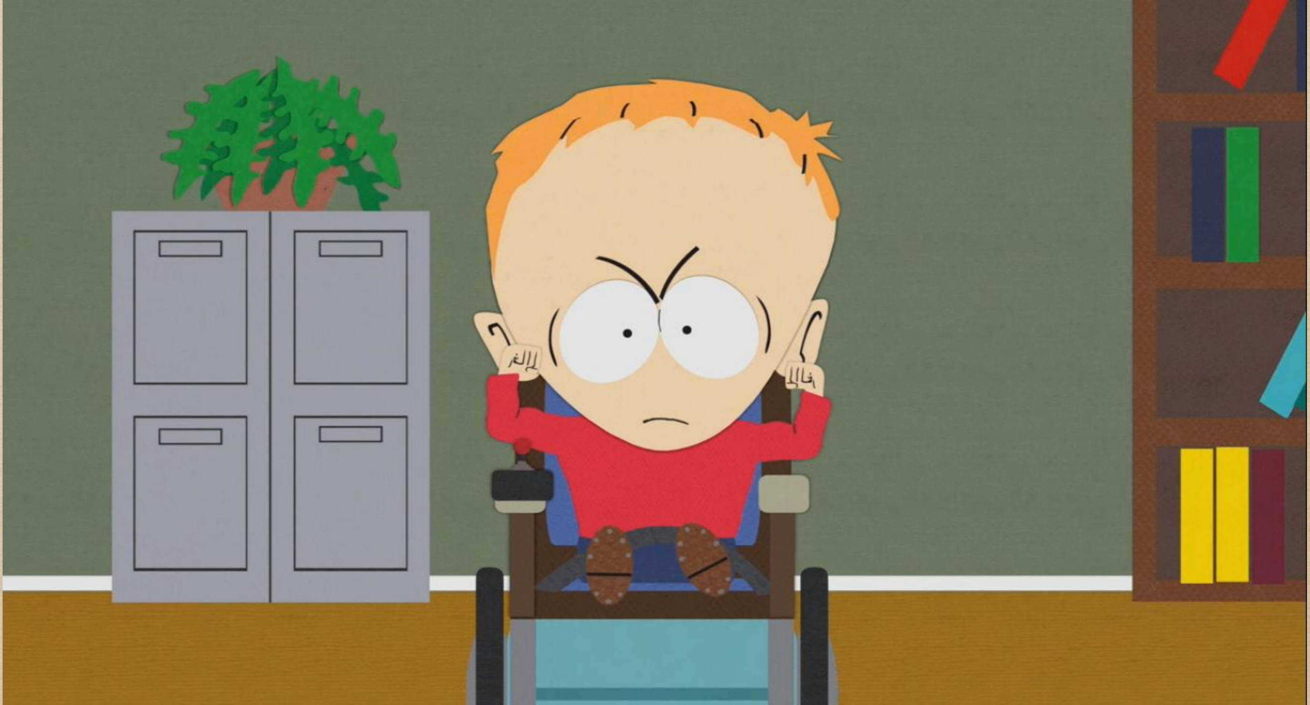
South Park izgi Filmindeki Timmy.