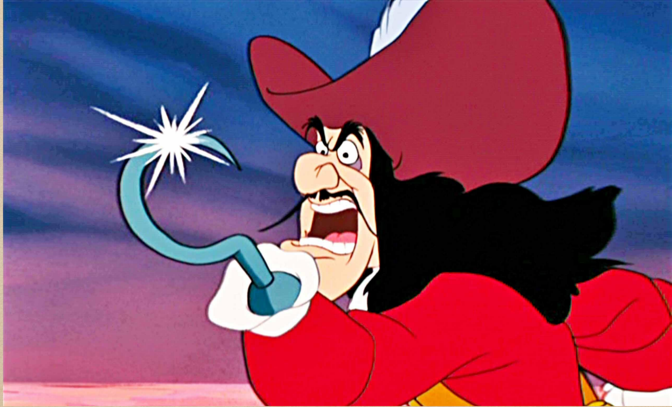
Peter Pan izgi Film indeki Kaptan Kanca.

Tekinsiz veya Őeytani olarak engelli karakter