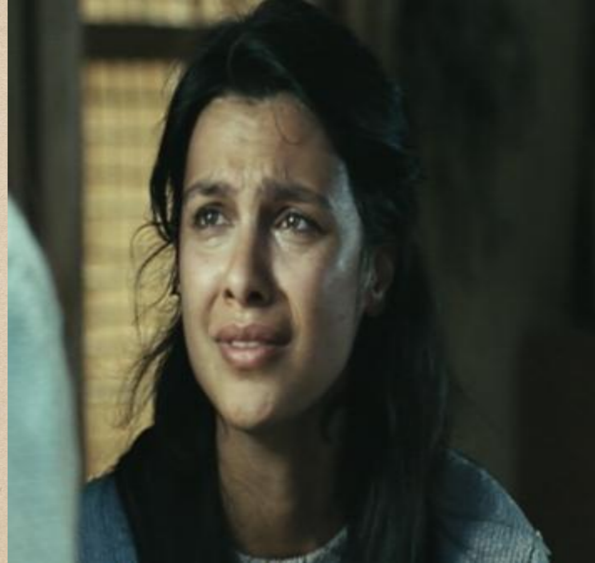
Ulak Filmindeki Engelli Karakter Havva.